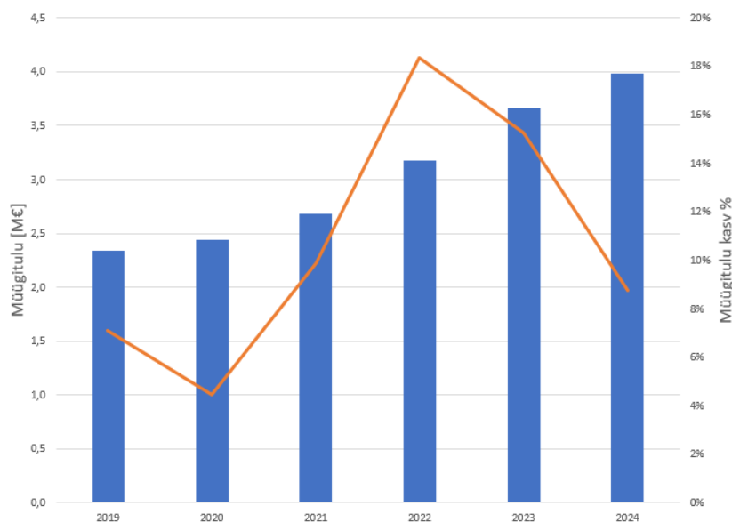
Joonis 1. Müügitulu kasv 2019 - 2024

Metroserdi müügitulu (3,98 M€) suurenes võrreldes eelneva perioodiga 9% (322 k€) võrra.